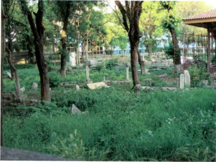
Resim 2: Mankalya Esmâ(han) Sultan Câmii Hazîresi'nden kısmî görünüm