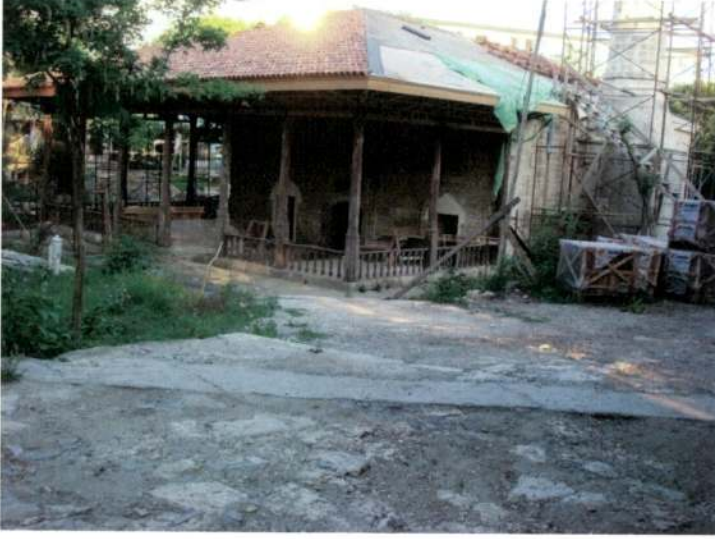
Resim 1: Mankalya Esmâ(han) Sultan Câmii'nin dıştan görünümü